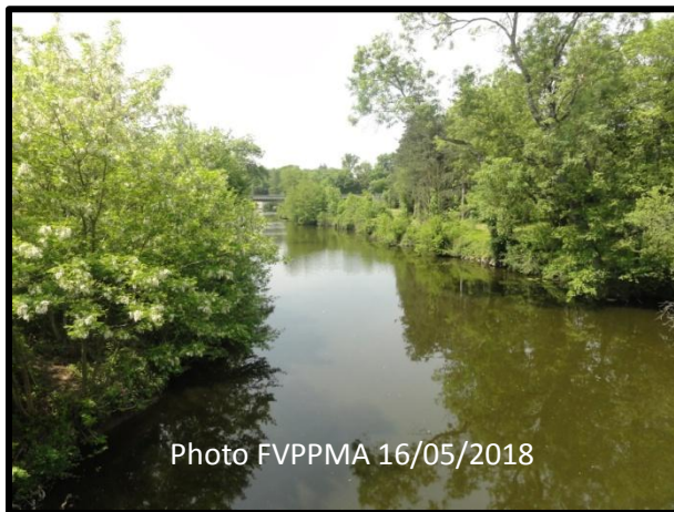
Photo FVPPMA 16/05/2018